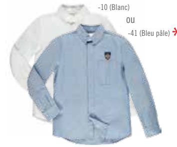
Style #CSM105J Chemise à manches longues 5-Oxford