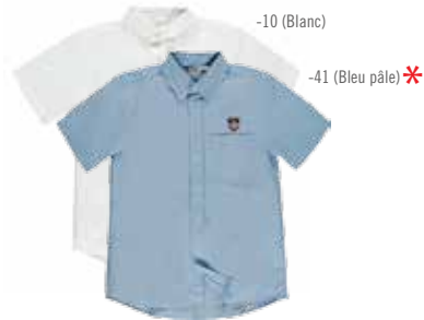
Style #CSM106J Chemise à manches courtes 5-Oxford