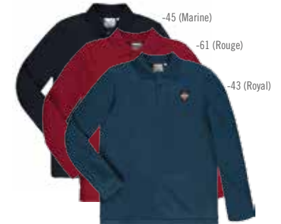
Style #CSM113J Polo à manches longues 4-Piqué