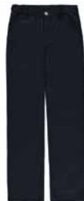
Style #CSM109J-45 Pantalon habillé 11-Gabardine