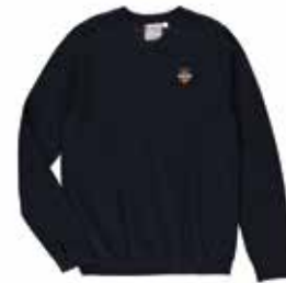
Style #CSM124J-45 Chandail à manches longues Maille