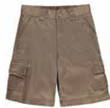
Style #CSM108J-14 Bermuda à poches cargos 10-Twill extensible