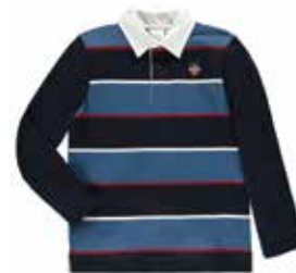
Style #CSM102J-4543 Chandail style «rugby» 14-Jersey épais