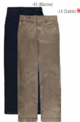
Style #CSM107J Pantalon 10-Twill extensible