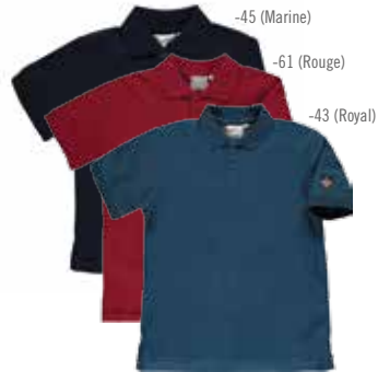
Style #CSM101J Polo à manches courtes 4-Piqué