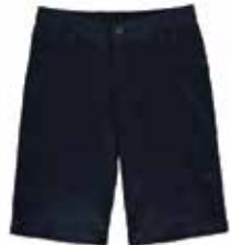
Style #CSM119J-45 Bermuda 10-Twill extensible