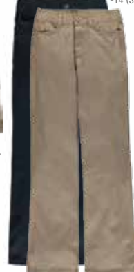
Style #CSM008 Pantalon 10-Twill extensible