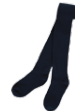
Style #HFM213J-45 Collant (à l'unité)