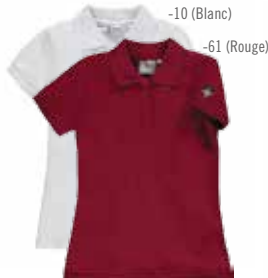
Style #CSM003J Polo à mancherons 3-Piqué