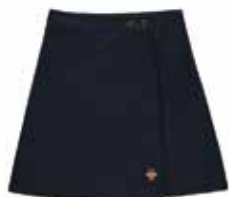
Style #CSM010J-45 Jupe portefeuille 11-Gabardine