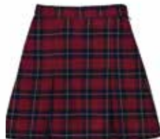
Style #CSM024J-4561 * Jupe à plis 11-Gabardine