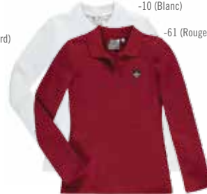
Style #CSM004J-61 Polo à manches longues 3-Piqué