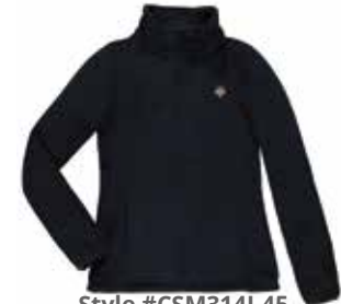
Style #CSM314J-45 Veste de polar à col 18-Polar