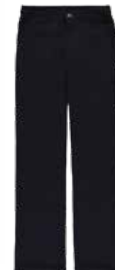
Style #CSM022J-45 Pantalon doublé 11-Gabardine