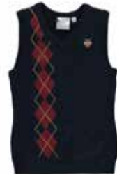
Style #CSM028J-4561 Débardeur à encolure en «V» 9-Tricot jersey