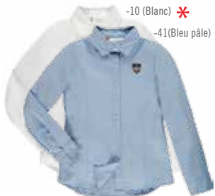
Style #CSM006J Chemise semi-ajustée à manches longues 5-Oxford