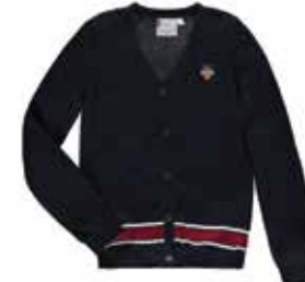
Style #CSM034J-4561 Cardigan à boutons 7-Maille