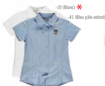
Style #CSM007J Chemise semi-ajustée 5-Oxford