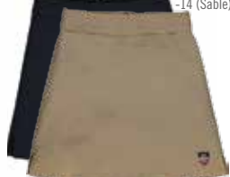
Style #CSM025J Jupe-culotte droite 20-Fortrel