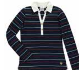
Style #CSM026J-4561 Chandail style «rugby» 14-Jersey épais