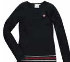
Style #CSM020J-4561 Chandail à encolure en «V» 8-Jersey double