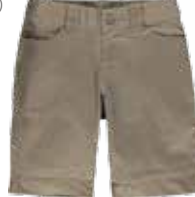
Style #CSM009J-14 Bermuda 10-Twill extensible